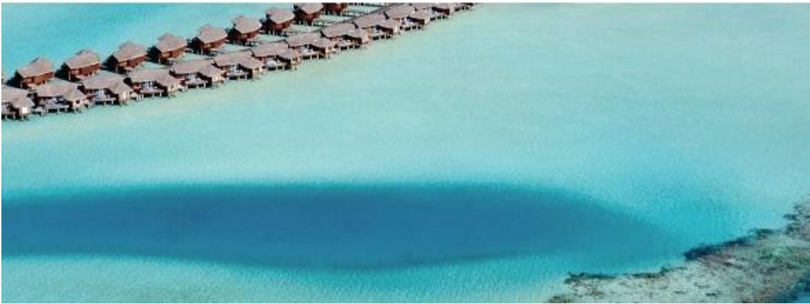
untamed wildlife | untamed beaches